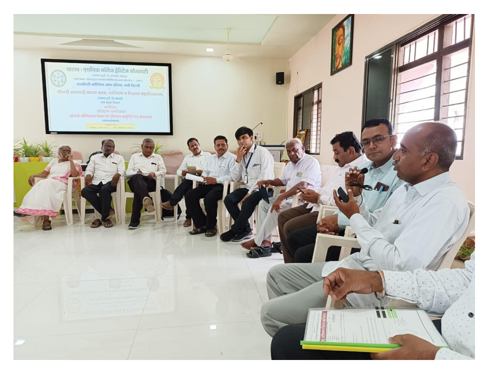
Panel discussion with Traditional healers