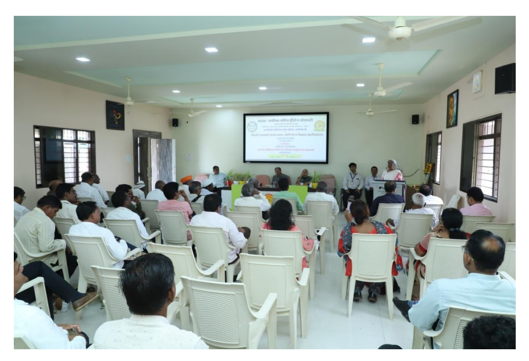
Participants in one day Training workshop